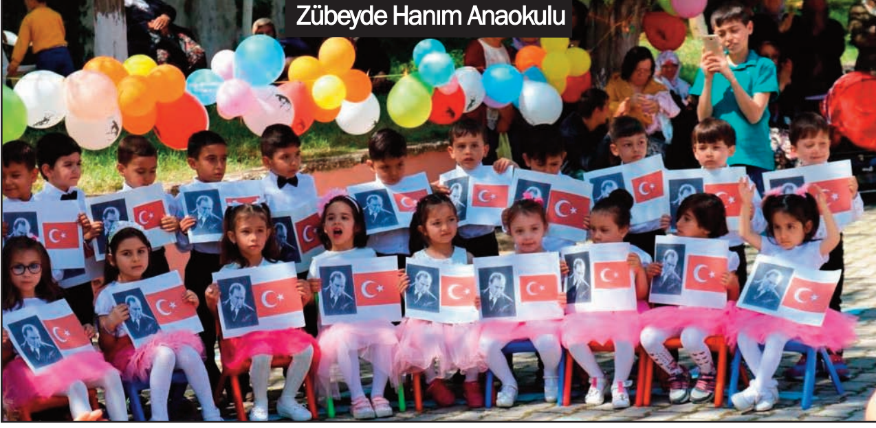
Zübeyde Hanım Anaokulu