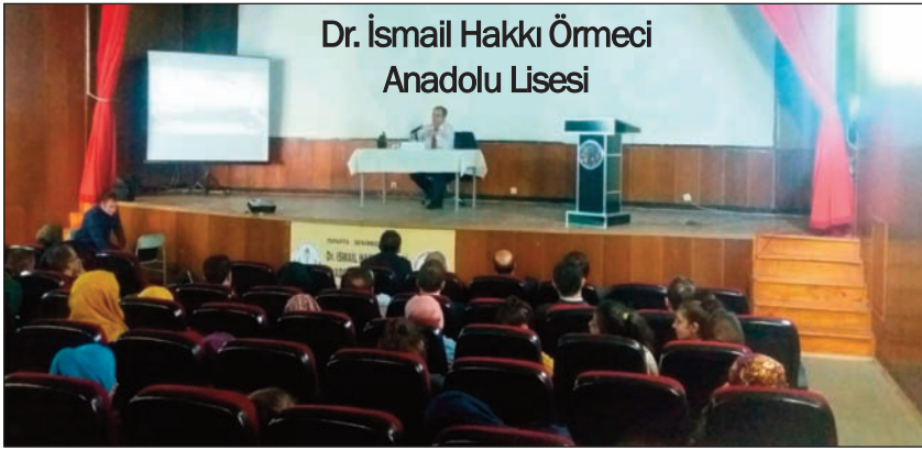
Dr. İsmail Hakkı Örmeci Anadolu Lisesi