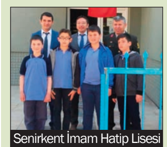
Senirkent İmam Hatip Lisesi

8. sınıf öğrencilerine motivasyon arttırmak amacıyla Isparta'da bulunan nitelikli liselere gezi düzenlenmiştir. Öğrenciler bu okulların