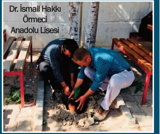
Dr. İsmail Hakkı Örmeci Anadolu Lisesi

Yapraklar kısa saplı, dar ve uzunca, tüylü, beyazımsı-grimsiyeşil renklindedir. Çiçekler dalların ucunda, uzun saplar üzerinde toplanmışlardır. Çiçekler küçük ve çok kısa saplıdır. Çanak ve taç yaprakları tüp şeklindedir. Meyveleri parlak siyah renklidir. Isparta'mızda