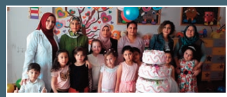
Senirkent Vilayetler Hizmet Birliği Anaokulu

Deniz Yıldızları Sınıfında bu ay toplu doğum günü kutlaması yapılmıştır. Anne Babalar ile hep beraber yapılan bu etkinlik çocukların güzel vakit geçirmelerini ve değerli olduklarını hissetmelerini sağlamıştır.