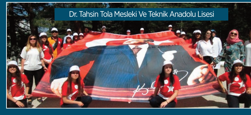
Dr. Tahsin Tola Mesleki Ve Teknik Anadolu Lisesi

Fuar esnasında öğrenci, öğretmen ve misafirlere çeşitli ikramlar sunuldu. Projeler sergilenirken öğrenciler hem eğlendiler hem de projelerinin sergilenmesi ile çalışmalarını herkese sunma fırsatı buldular. Şenlik tadında güzel bir etkinlik olarak okulumuzda fuar etkinlikleri gün boyunca sürdü.