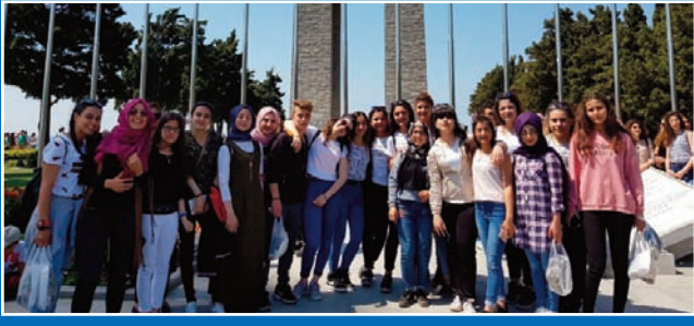
Senirkent Çok Programlı Anadolu Lisesi