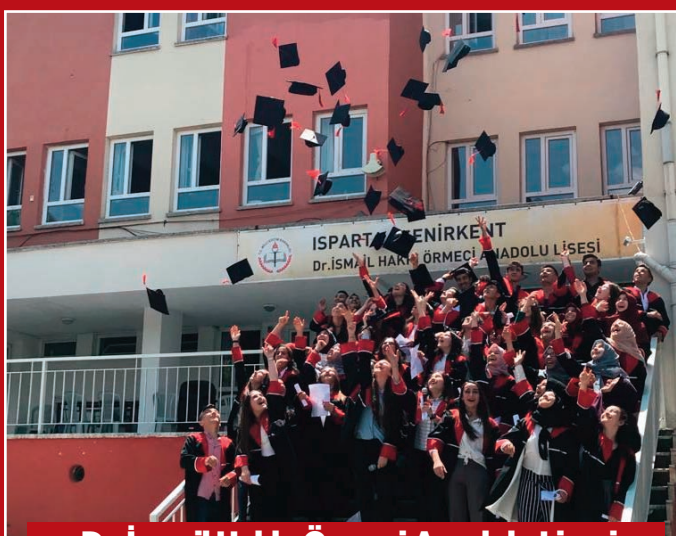
Dr. İsmail Hakkı Örmeci Anadolu Lisesi

Aslında o günlerde kutladığımız şeyler, öğrendiklerimiz ve yeni bir insana dönüşmemizdir. 12. Sınıf öğrencilerimiz okul bahçemizde eğlendi. Kep attı. Diploma aldı. Kutlamaya idareciler, öğretmenler, veliler ve öğrenciler iştirak etti. Öğrencilerimize hayatlarının bu yeni döneminde başarılar diliyoruz.