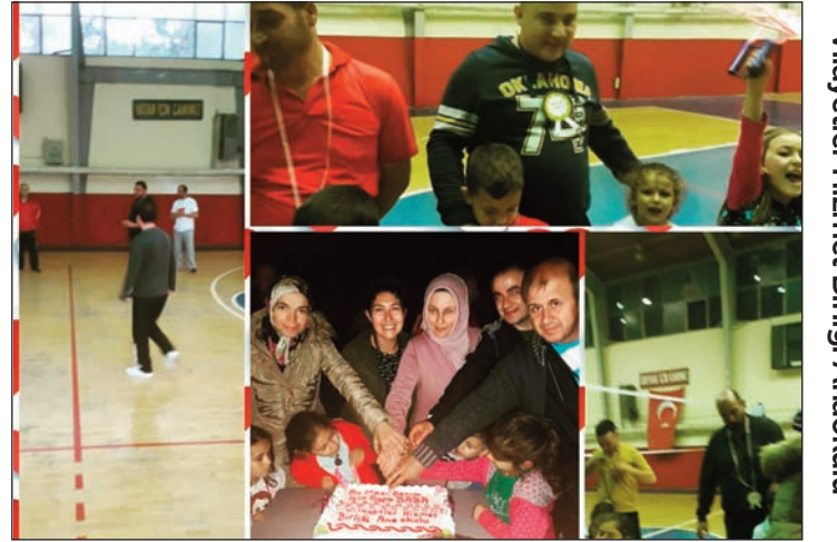
Vilayetler Hizmet Birliği Anaokulu

davet edildi. Gönüllü olarak okula gelen babalarımız öğrencilerle Çim adam, Parmak izi deneyi vb. etkinlik yaparak hem eğitim için de var olduklarını göstermiş hem de çocukların babalarıyla eğlenerek öğrenmelerini sağlamışlardır.