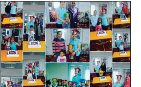
Vilayetler Hizmet Birliği Anaokulu

İçinde bulunduğumuz Eğitim-Öğretim döneminde 5 Yaş grubu olan Pamuk Şekerleri öğrencilerinin Anaokuluna veda etmeleri nedeniyle parti düzenlenerek pasta kesimi yapıldı. Çocuklar Bir yaş daha büyümelerini aynı zamanda da yeni bir okula gidecek olmalarını kutladılar.