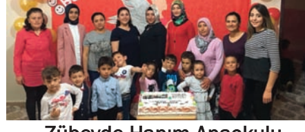
Zübeyde Hanım Anaokulu

duygularını söyledikleri video gösterisi yapıldı. Melek aneme bir buket çiçek vererek annelerinin anneler gününü kutlayan öğrencilerimiz anneleri için pasta kesmeyi de unutmadılar.