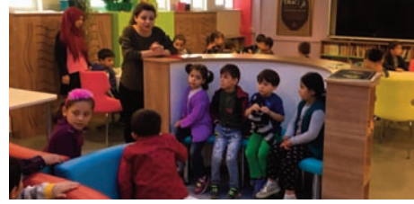
Zübeyde Hanım Anaokulu

Senirkent ilçe kaymakamlığımızın başlatmış olduğu Senirkent'te sıfır atık projesine okulumuz olarak destek verdik ve kâğıt, plastik, cam, pil atık malzemelerini toplamaya başladık.