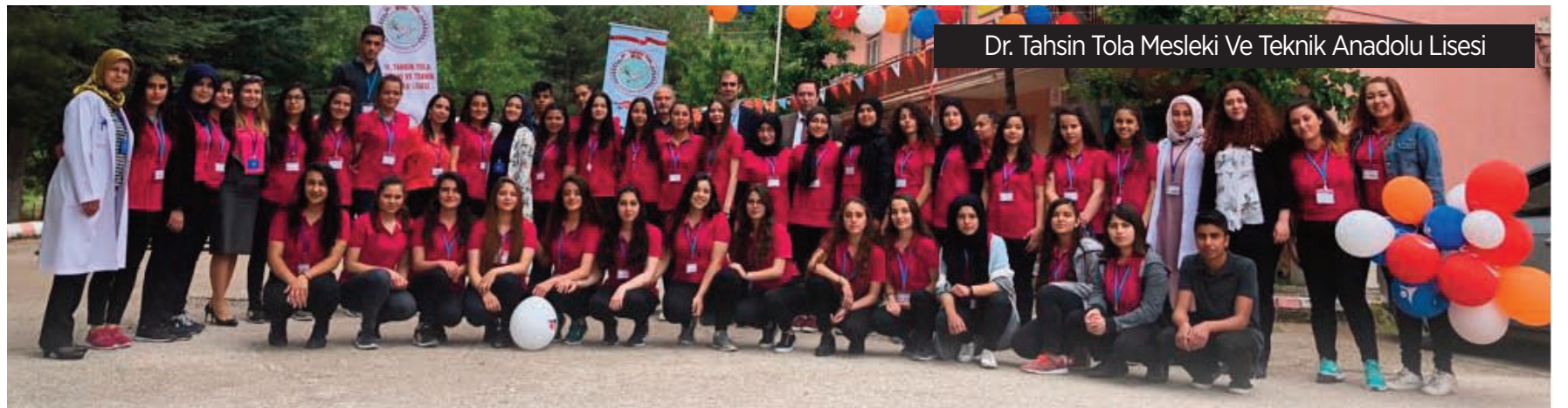
Dr. Tahsin Tola Mesleki Ve Teknik Anadolu Lisesi