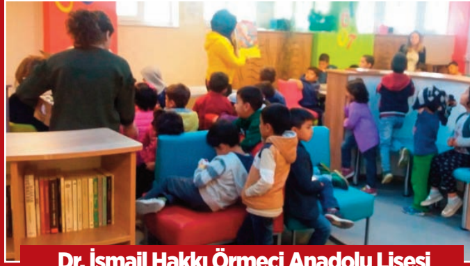
Dr. İsmail Hakkı Örmeci Anadolu Lisesi

4x100 metre bayrak yarışları erkekler kategorisinde üçüncülük elde etmişlerdir.