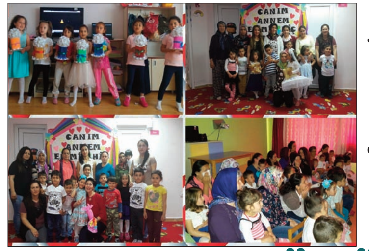
Vilayetler Hizmet Birliği Anaokulu

sürdürüldü. Bu eğitimin pekiştirici olması amacıyla polislerimiz tarafından içinde basit trafik kurallarının olduğu boyama kitapları hediye edildi. Bu eğitim çalışması için İlçe Emniyet Amirliği personellerimize çok teşekkür ederiz.