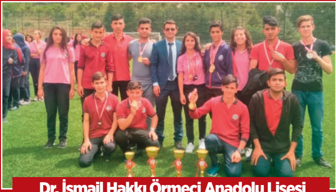
Dr. İsmail Hakkı Örmeci Anadolu Lisesi