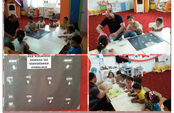
Vilayetler Hizmet Birliği Anaokulu

slaytlar izletildi, çocuklar tarafından oratoryo gösterisi yapıldı. Anneler günü şarkıları söylendi, sonrasında çocuklar annelerine hediyelerini sundular.