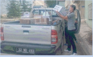
Senirkent Mesleki ve Teknik Anadolu Lisesi

Hakan Haşhaş-Erol Durmuş Sarraf-Vodafon Bayi-Yürekli Market- Kunt Köşem-Balınoğlu Mobilya- Foto Gözde- Güven Hırdavat-Nogay Sigorta-Atlas Kırtasiye-Eşmeliolu Market-Kocadağ Market-Alkanlar Market-Boncuk Lokantası Tüm esnaflarımıza öğretmen ve öğrencilerimize teşekkürü bir borç biliriz.