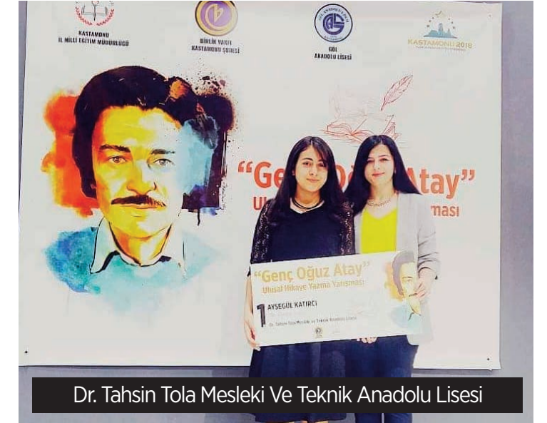
Dr. Tahsin Tola Mesleki Ve Teknik Anadolu Lisesi